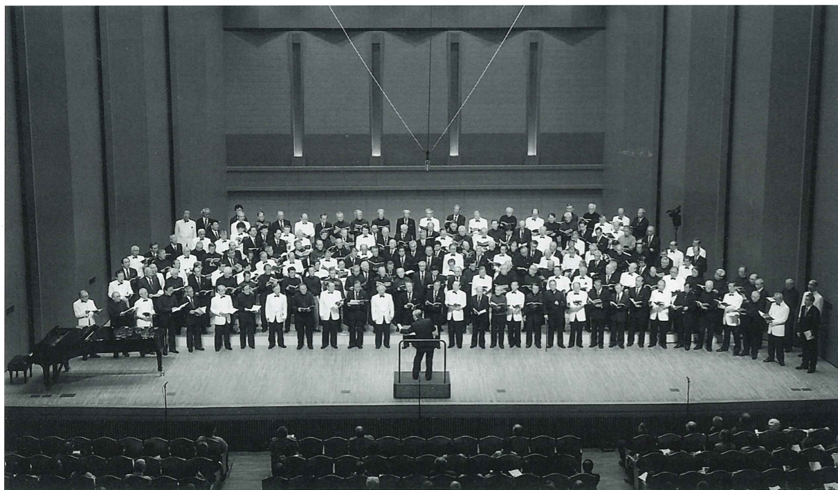
2009年11月29日 旧三商大交歓音楽会 於 大田区民ホール 合同演奏「月光とピエロ」